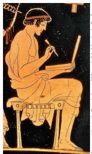
Copie antique de Doulos (vers 485 av. J.-C.), Musée de Bielefeld.